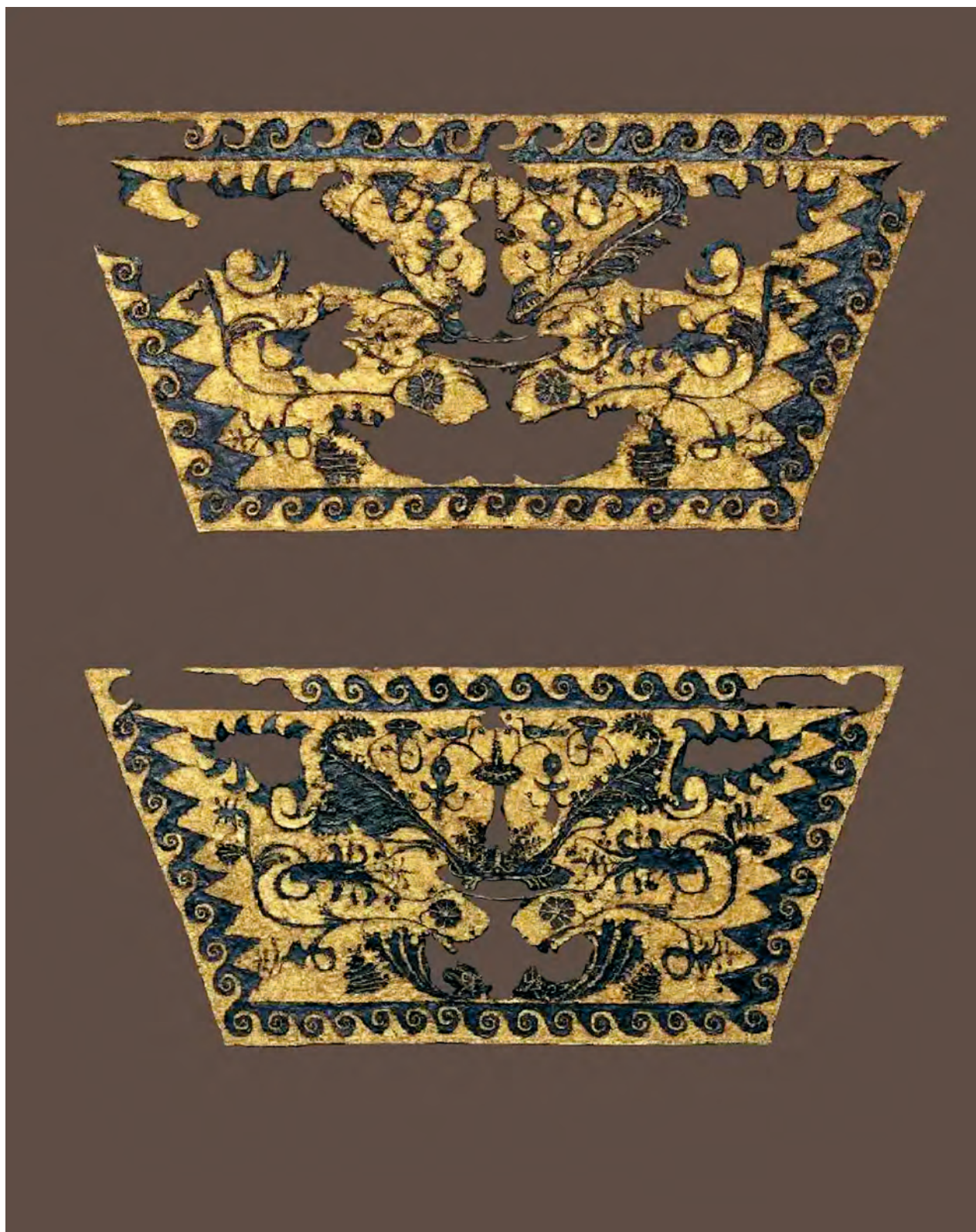
Fig. 2. Fantastiske stoffer vævet med guld- og purpurfarvede tråde kendes fra kongegraven kaldet "Filips grav" i Vergina. De lå i et guldskrin, som var placeret i en marmorsarkofag, og ifølge arkæologerne var de kostbare tekstiler viklet om en kvindes knogler. De ser derfor ikke ud til at være direkte knyttet til Alexander den Stores far, kong Filip d. II af Makedonien, men deres enestående kvalitet viser tydeligt, at de tilhørte kongens entourage .**