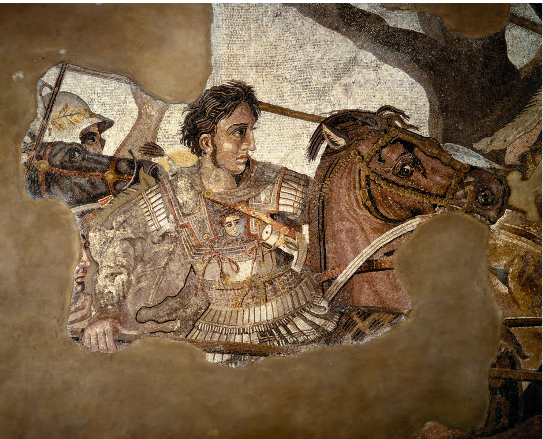
Fig. 5. Alexander den Store i kamp før han fik smag for den persiske mode. Portrættet er malet af Philoxenos fra Eretria, som var hofmaler hos de makedonske konger i 300-tallet f.v.t. Portrættet blev kopieret i et mosaikgulv i en pompeiansk villa. Her vises et udsnit af mosaikken. Det arkæologiske Museum, Napoli.