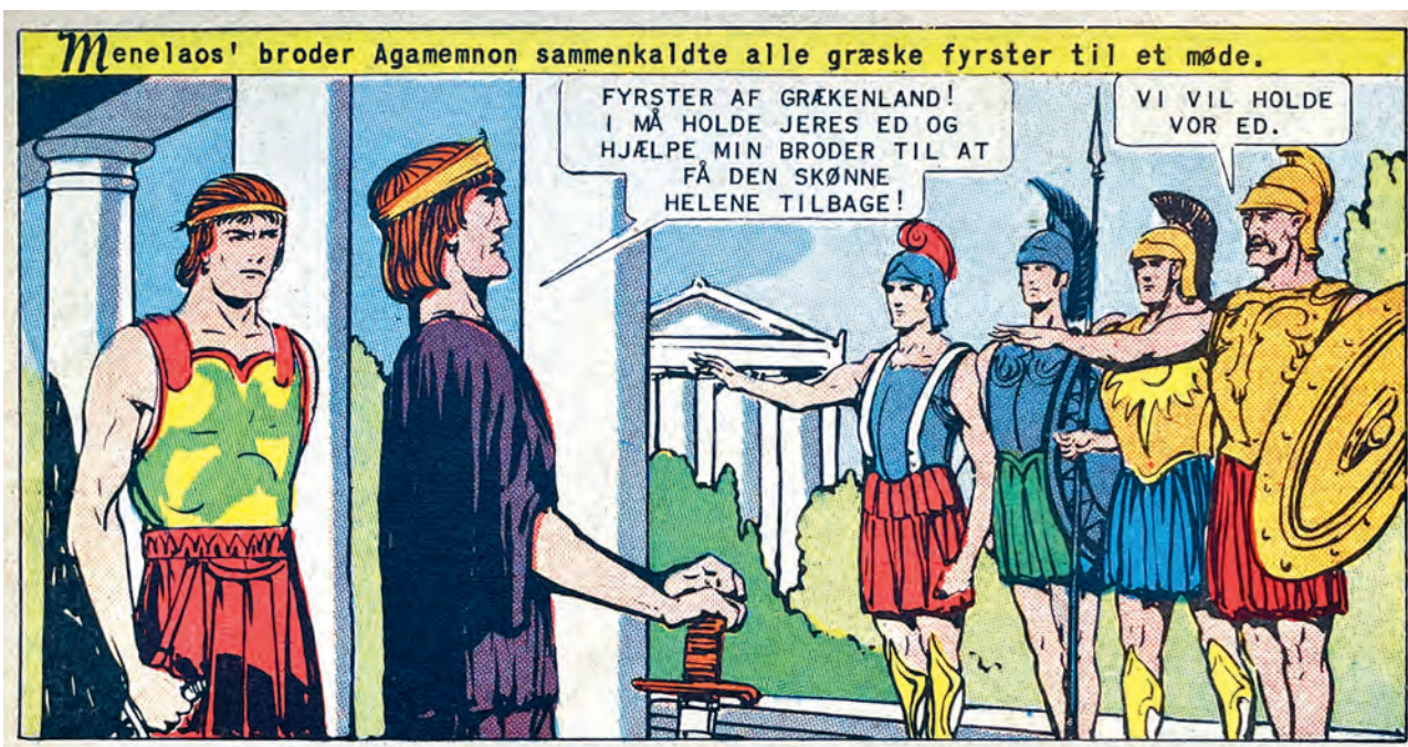
Fig. 4. Illustrerede Klassikere var en populær amerikansk tegneserie fra 1940'erne. Det danske forlag fik i 1956 den berømte klassiske filolog, Otto Gelsted, som netop have færdiggjort sin nyoversættelse af Iliaden og Odysseen til moderne lyrisk prosa, til at skrive dialogerne til tegneserien. Tegneren har hverken kendt til dechifring af Linear B eller til de arkæologiske fund af bronzealderens paladser, våben eller freskoer men har valgt at tegne de homeriske helte i en klassisk græsk stil. Kong Agamemnon er dog kendetegnet ved en guldtiara og purpurfarvet dragt.