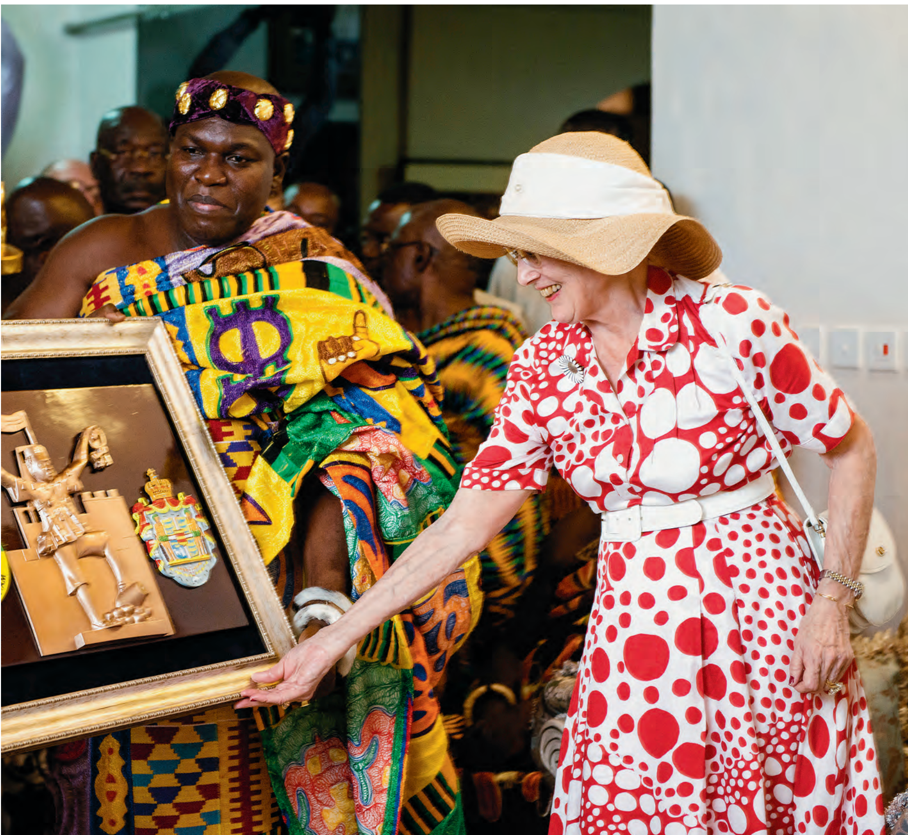
Kong Odenho Kwafo Akoto d. III, leder af Akwamu-folket i Ghana, i en draperet dragt af vævet og broderet kente-stof. Kente er en tradition i Vestafrika og findes både i denne en håndvævede kvalitet og i de billigere versioner, hvor mønstret er lavet med stoftryk. Hans stof-tiara er i lilla velour med guld-ornamenter med referencer til antikken. H.M. Dronningen mødte kongen ved et officielt besøg i Ghana i 2017 og var i Dannebrog's farver udtrykt i prikket stofmønster samt den ikoniske marguerittebroche.