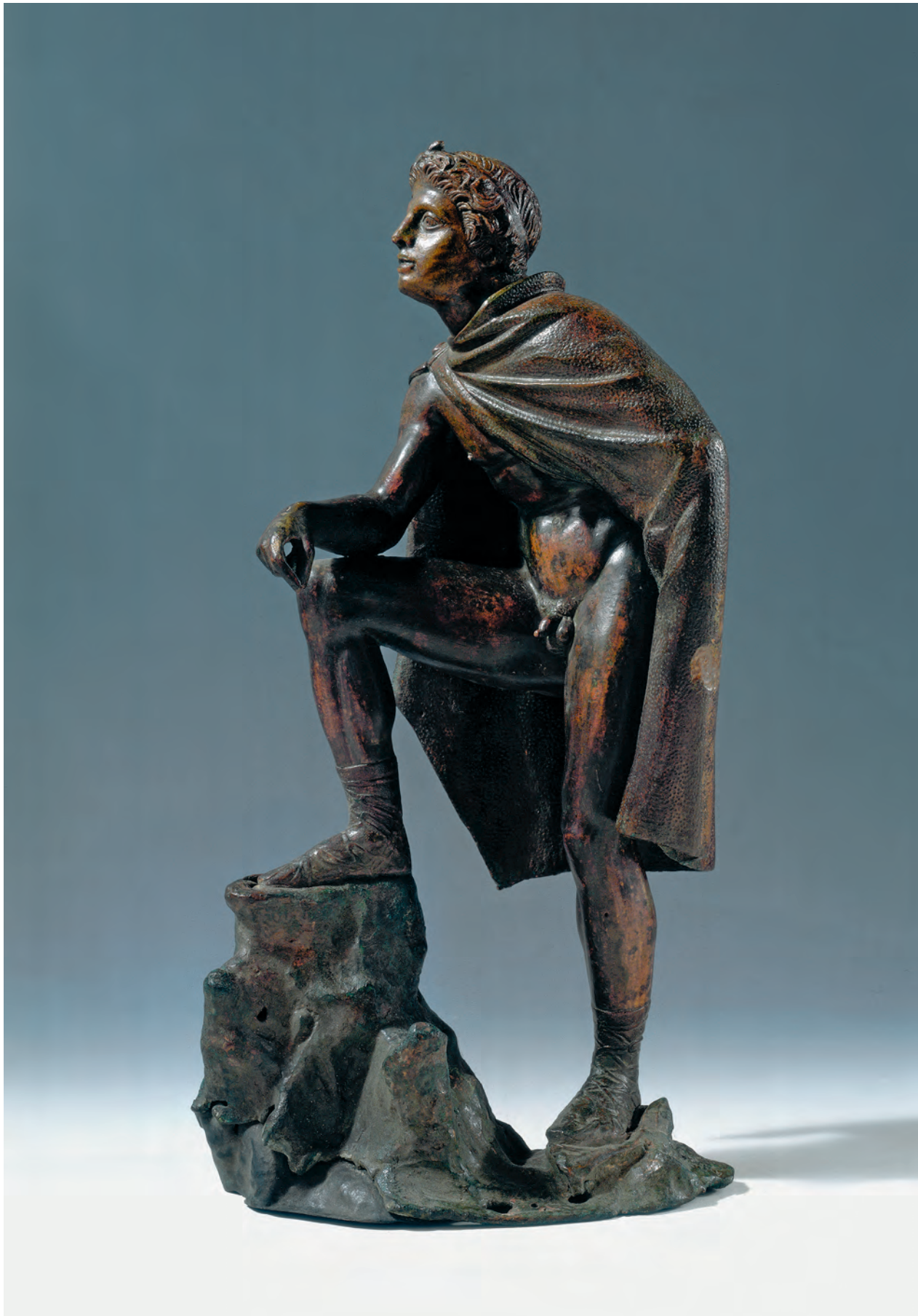
Fig. 6. Statuette af kong Demetrios d. I Poliorketes, måske iført den kostbare kosmologiske kappe med indvævede motiver af himmellegemer og hele universet. Napoli, Det arkæologiske Museum.