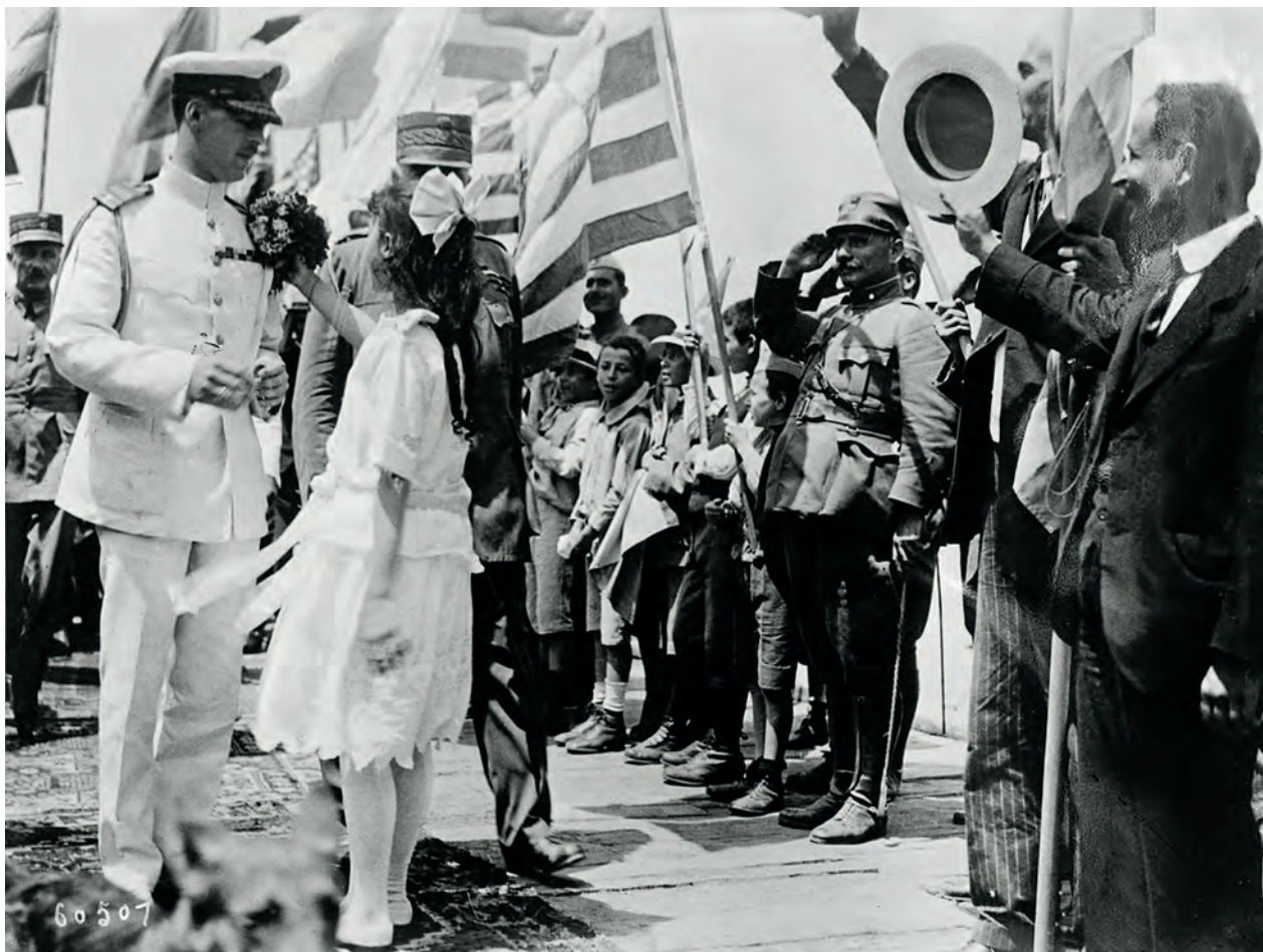
Kong Alexander 1. afløste kong Konstantin 1. efter, Entente magterne tvang denne til at abdicere i 1917. Alexander døde den 25. oktober 1920 i en alder af blot 27 år som en følge af blodforgiftning. Kort tid blev der afholdt en folkeafstemning, der bestemte, at Konstantin 1. kunne vende tilbage fra sit eksil.

og privilegier rodfastet i det gamle regime. Denne var forsvundet med løsrivelsen fra Osmannerriget. Der fandtes jordejere og krigsherrer men hverken storgodsejere eller en statselite som i Danmark med forbindelser til det gamle regime, der knyttede dem tæt til kongen.