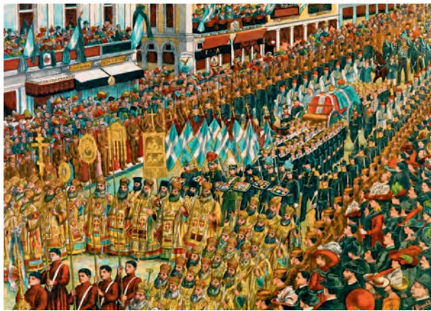
Georg 1.s ligfærd. Samtidigt litografi af Sotiris Christidis.