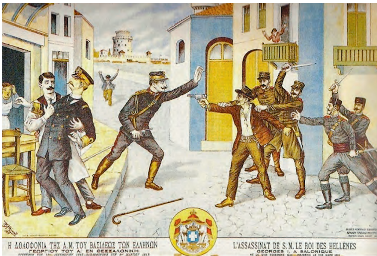
Mordet på kong Georg 1. den 18.marts 1913 i Thessaloniki.

forhold til regeringsdannelse, det parlamentariske princip, dvs. den praksis, at det var et flertal i parlamentet, som udpeger regeringen. Mens den almindelige stemmeret for mænd over 21 år allerede lå i 1844-forfatningen og blev indført i 1864, imødekom Georg 1. kravet om det parlamentariske princip i 1875. Dette er bemærkelsesværdigt, hvis vi sammenligner med udviklingen i hans gamle hjemland, fordi kong Georg 1. accepterede det parlamentariske princip mere end 25 år før det blev knæsat i Danmark og fordi han gjorde det mere eller mindre sammenfaldende med begyndelsen på den lange og opslidende forfatningskamp i Danmark, som først blev afsluttet med systemskiftet i 1901.