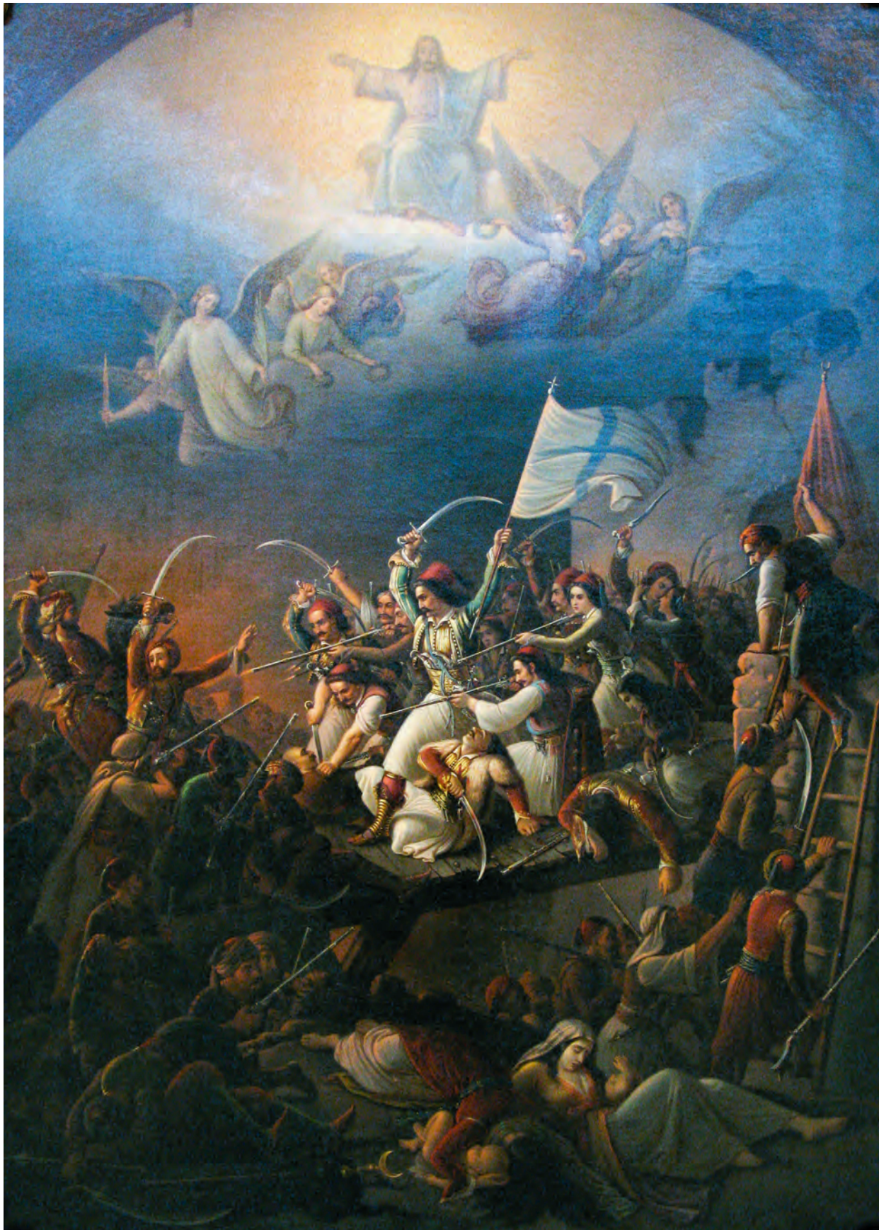
Den græske Revolution begyndte i 1821, og udviklede sig i de efterfølgende år til en uafhængighedskrig. Den blev et anliggende i europæisk meningsdannelse, som fik en sådan styrke, at det endte med at bevæge stormagterne til at gribe ind til fordel for den græske sag. Theodoros Vryzakis, The Exodus from Missolonghi , 1853 (National Gallery–ASM).